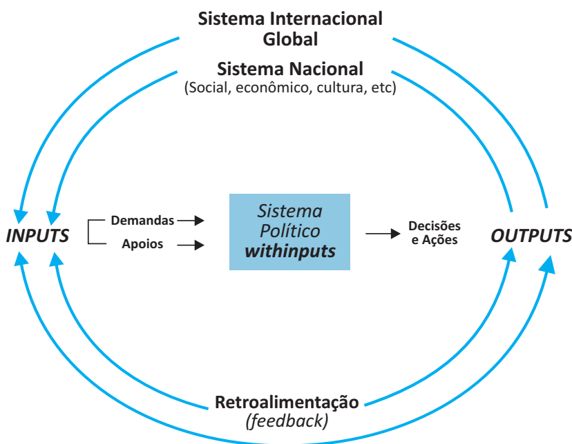
Figura 1: Sistema político

Os inputs são as demandas e apoios encaminhados ao sistema político. Podem ser, por exemplo, reivindicações de bens e serviços, como saúde, educação, estradas, transportes etc. ou demandas por participação, como direito ao voto ou à representação política. Os apoios nem sempre estão vinculados a demandas ou políticas específicas –, mas podem estar direcionados ao próprio sistema político, ou para quem governa. Exemplos de apoio são a obediência civil (o cumprimento de leis e regulamentos); a participação política, mesmo no simples ato de votar; o respeito à autoridade do Estado e suas instituições. Estes são apoios passivos , pois não exigem nenhum esforço especial por parte dos atores envolvidos e podem resultar até mesmo da conformidade obtida mediante a socialização. Mas há apoios também ativos , como o envolvimento na implementação de determinados programas governamentais, a participação em manifestações públicas, etc. Além disso, os apoios podem ser afirmativos , que é quando expressam legitimação, credibilidade; ou, negativos , quando representam a negação da legitimidade. A sonegação de impostos, a abstenção eleitoral, as manifestações popu-